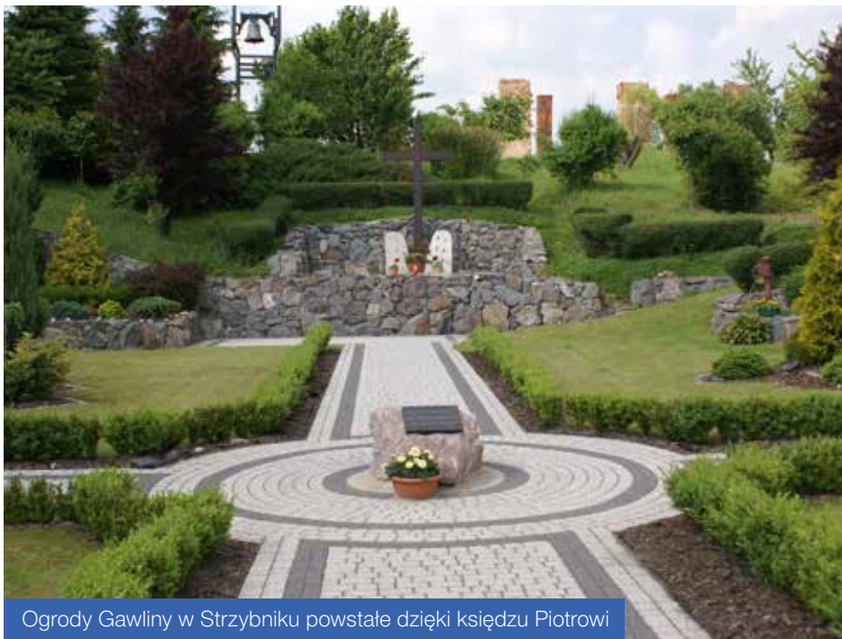
Ogrody Gawliny w Strzybniku powstałe dzięki księdzu Piotrowi