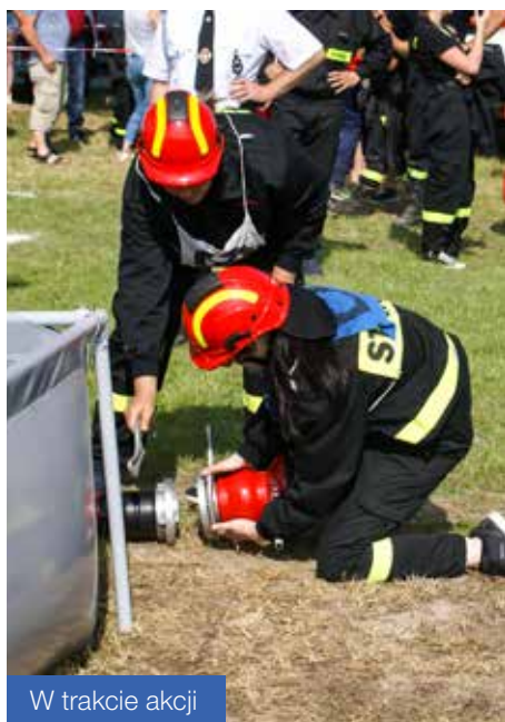
W trakcie akcji