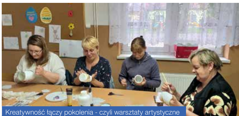
Kreatywność łączy pokolenia - czyli warsztaty artystyczne

Czas konkursu: do 30 sierpnia 2019 r. Regulamin Konkursu oraz niezbędne zgody Dostępne są na stronach: www.gbprudnik.naszabiblioteka.com www.gmina-rudnik.pl oraz w gminnej Bibliotece Publicznej w Rudniku, w sekretariacie Urzędu Gminy w godzinach urzędowania