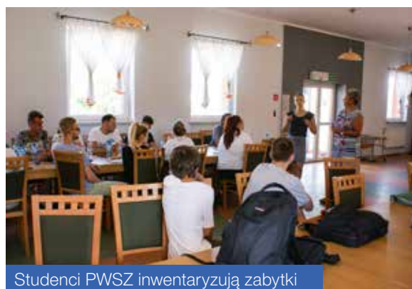
Studenci PWSZ inwentaryzują zabytki