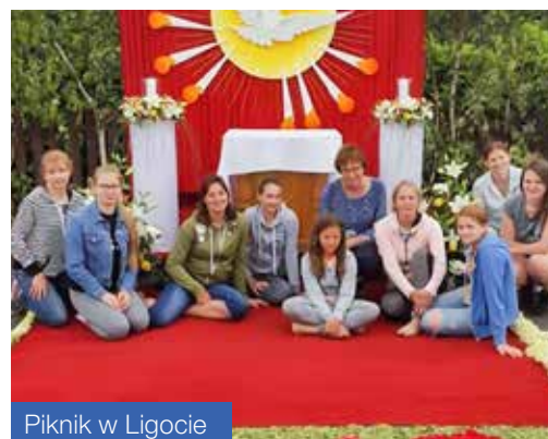
Piknik w Ligocie