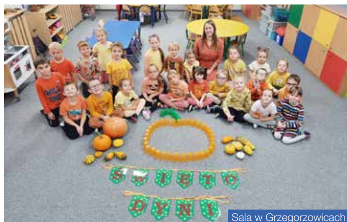
Sala w Grzegorzowicach