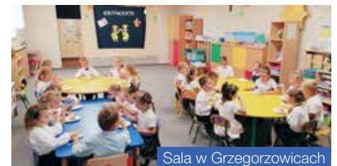
Sala w Grzegorzowicach

Do wszystkich, dla których taki stan rzeczy jest w jakiejś mierze uciążliwy, kierujemy przeprosiny, dziękując zarazem za cierpliwość. Składamy również podziękowania dla społeczności sołectwa Sławików i sołectwa Grzegorzowice za wyrozumiałość i odstąpienie swoich świetlic na tak długi czas, najmłodszym potrzebującym mieszkańcom Gminy.