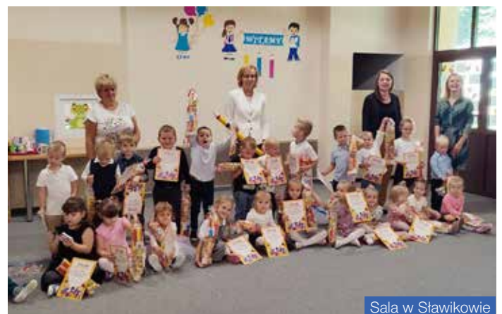
Sala w Sławikowie